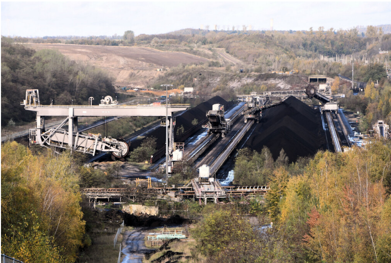
Tagebau Fortuna: Kohlebunker Fortuna mit Kohlevorratsgraben 908 (links) und Kohlenhalde 915 (rechts), Ansicht von Südosten; Foto: 09.11.2022