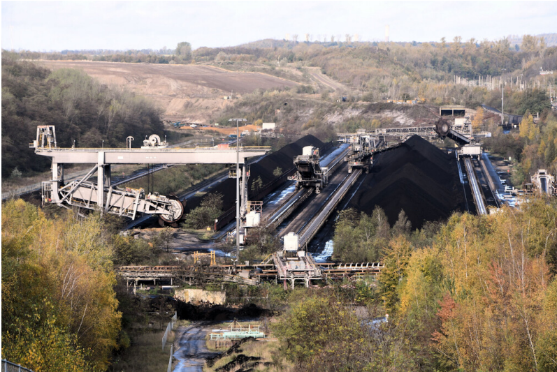
Tagebau Fortuna: Kohlebunker Fortuna mit Kohlevorratsgraben 908 (links) und Kohlenhalde 915 (rechts), Ansicht von Südosten; Foto: 09.11.2022