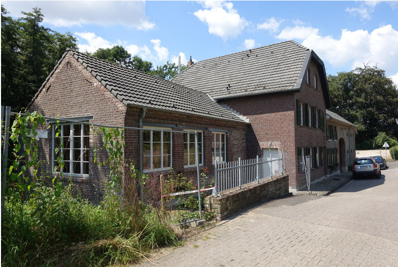
Romersmühle (Hückelhoven) (2016)