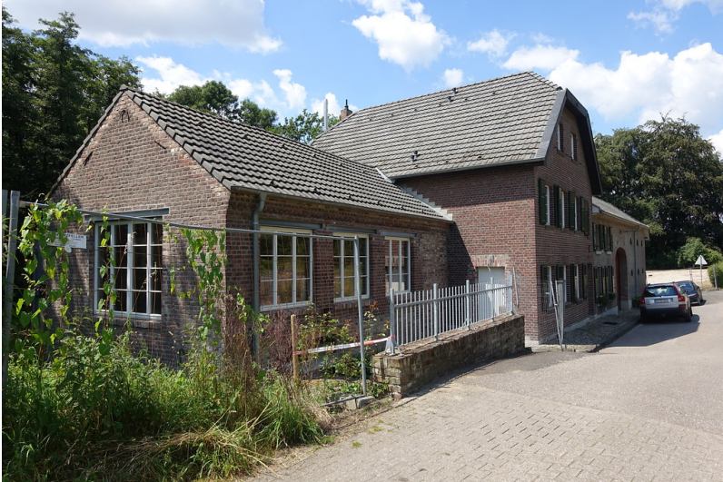
Romersmühle (Hückelhoven) (2016)