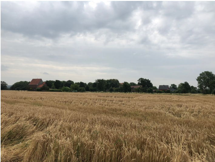
Einzelsiedlung Rolland (2023)