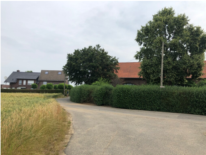
Horsterhof Unterbruch (2023)

Schlagwörter: Hof (Landwirtschaft), Einzelsiedlung Fachsicht(en): Kulturlandschaftspflege, Landeskunde Gemeinde(n): Heinsberg Kreis(e): Heinsberg Bundesland: Nordrhein-Westfalen