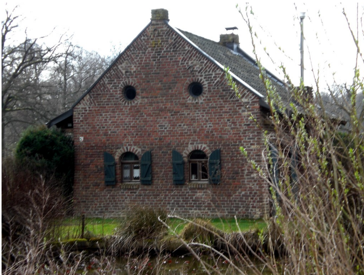
Backhaus von Gut Kromland (2008)