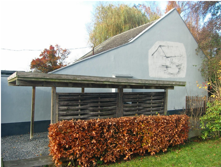
Standort der Birgeler Mühle mit dem Teich (2012)