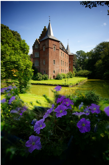
Blick auf die Hauptburg von Schloss Elsum in Wassenberg (2011)