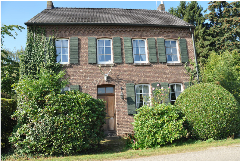
Forsthaus Kromland (2016)