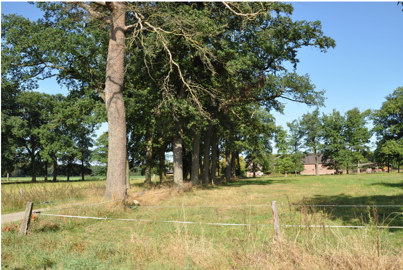
Baumreihe und Backsteinbauten des Gutes Kromland (2016).