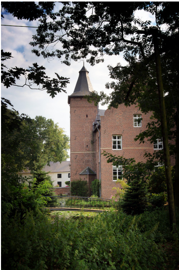
Teilsicht der Hauptburg von Haus Effeld in Wassenberg (2010).