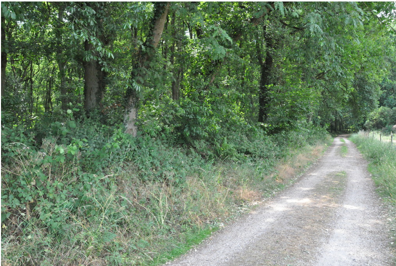
Ophovener Wald (2017)