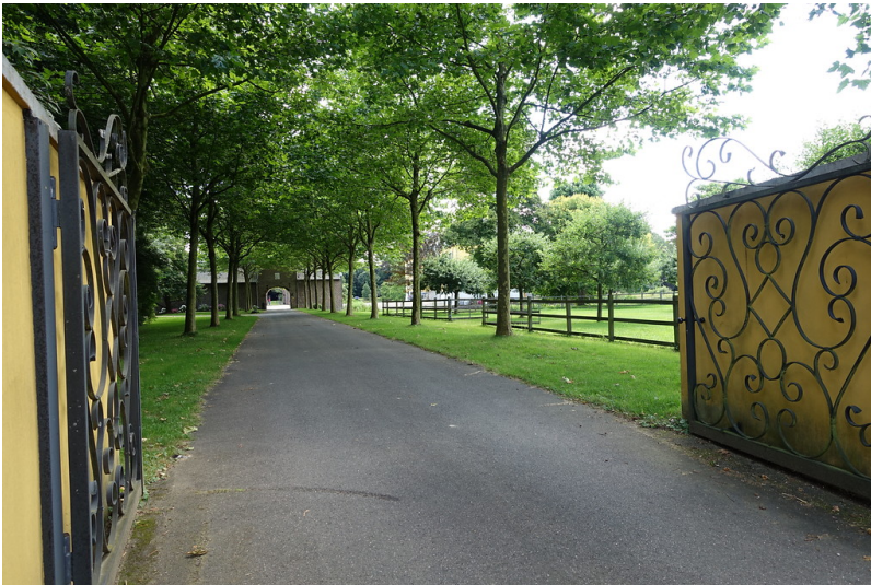
Blick durch das Tor auf die Toreinfahrt der Vorburg von Haus Hall (2016).

Schlagwörter: Herrenhaus (Bauwerk), Wasserburg Fachsicht(en): Kulturlandschaftspflege, Landeskunde Gemeinde(n): Hückelhoven Kreis(e): Heinsberg Bundesland: Nordrhein-Westfalen