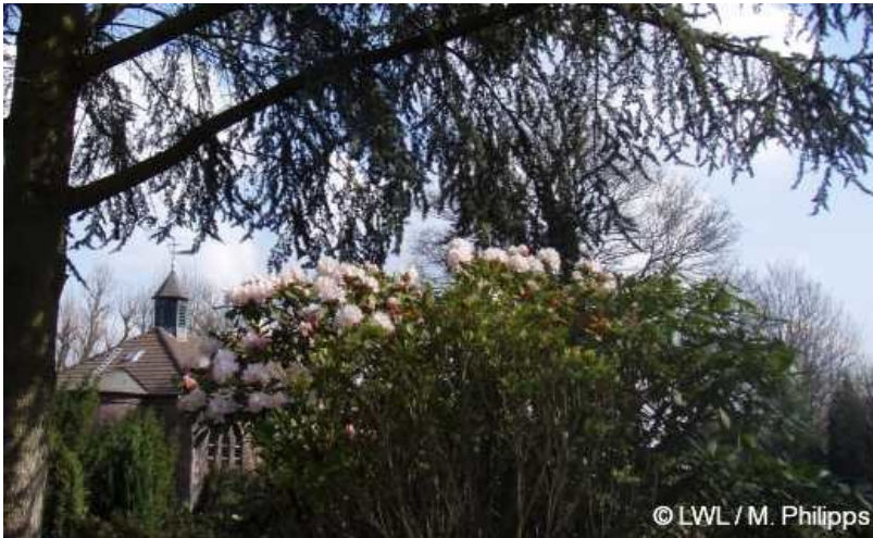
2008: Friedhof Sankt Lambertus Castrop

Blick auf die Fläche des ehemaligen Friedhofs St. Lambertus in Castrop-Rauxel (2008)