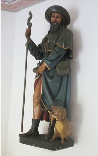
Sankt Rochus-Heiligenfigur in der Rochuskapelle Seligenthal bei Siegburg (2016).