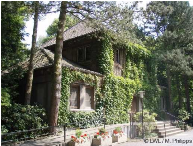
2008: Leichenhalle des Friedhofs Ickern

Leichenhalle des Friedhofs Ickern in Castrop-Rauxel (2008).