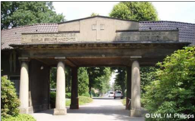
2008: Portal des Friedhofs Bladenhorst

Friedhof Bladenhorst (2008)