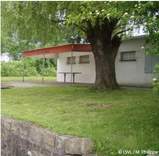
2008: Badeanstalt Neptun

Badeanstalt Neptun (2008)