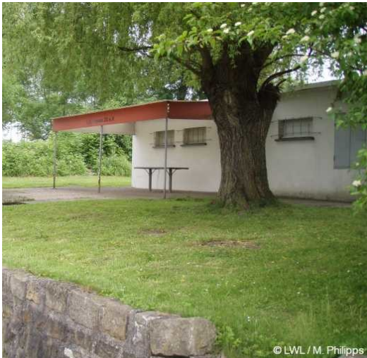
2008: Badeanstalt Neptun

Badeanstalt Neptun (2008)