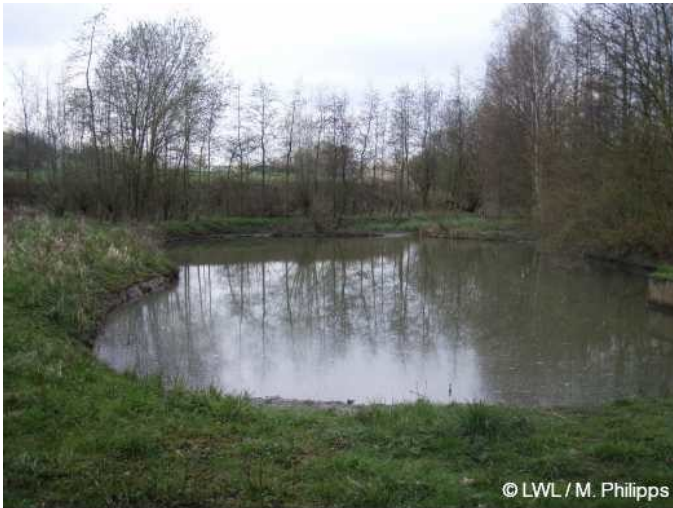
2008: Mühlenteich in Frohlinde

Mühlenteich in Frohlinde (2008)