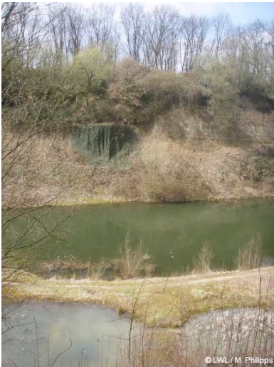
2008 Tongrube Lessmöllmann

Tongrube Lessmöllmann (2008)