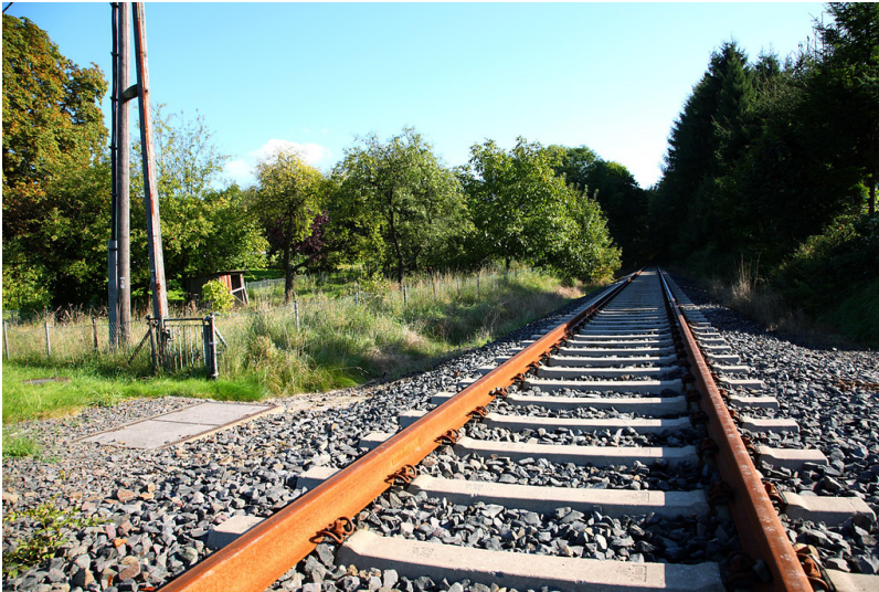
Trasse der Wippertalbahn in Börlinghausen (2008).