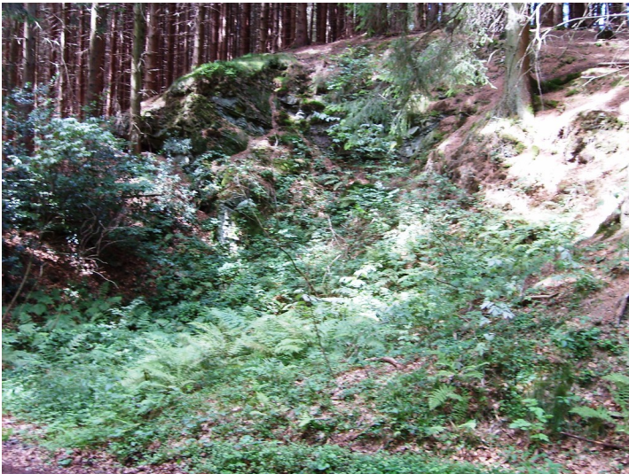
Halbkreisförmiger Steinbruch an der Straße nach Niederboinghausen (2009)