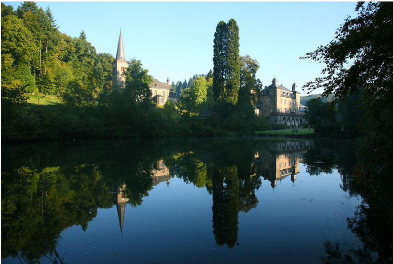
Schloss Gimborn, Schlossteich und Katholische Kirche Sankt Johannes Baptist (2008)