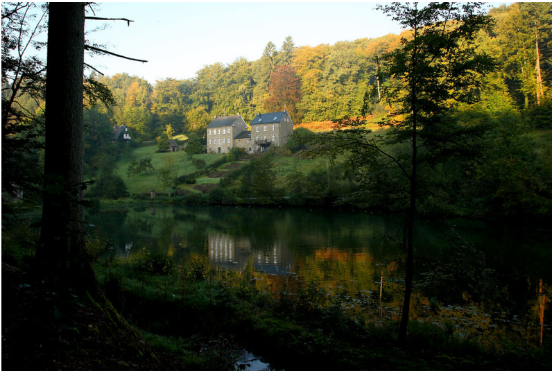
Pfarrhaus und Küsterhaus in Gimborn (2008)