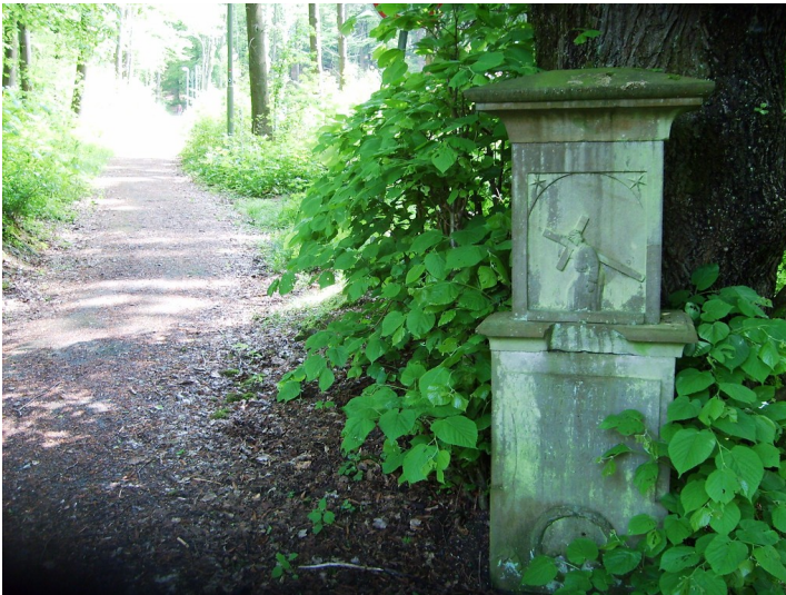
Bildstock am Hohlweg bei Ahe (2009)