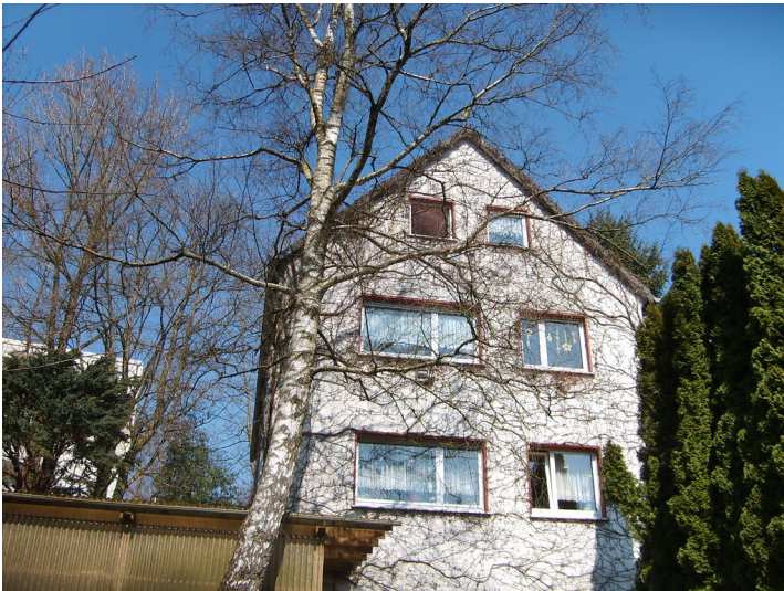
Standort des ehemaligen Klostergebäudes in Singern (2009)