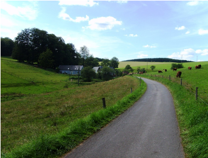
Blick auf den Einzelhof Unterpentinghausen (2009)