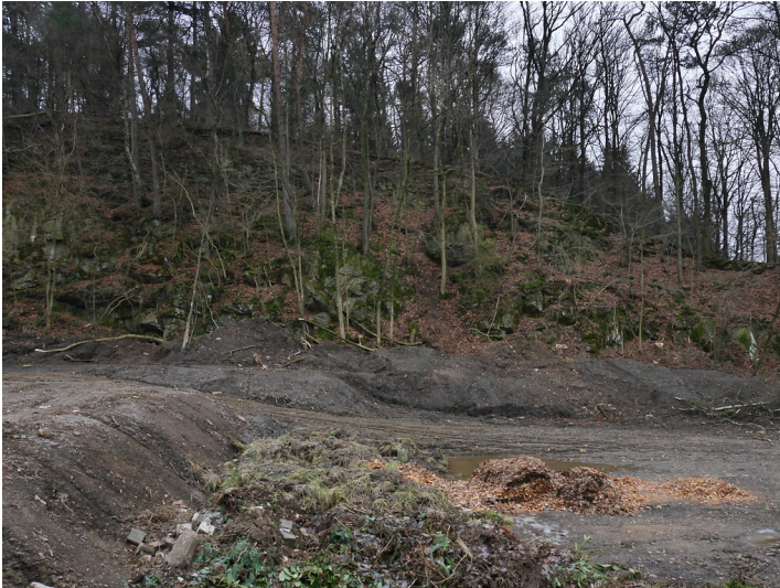
Steinbruch Jörgensmühle. (2018)