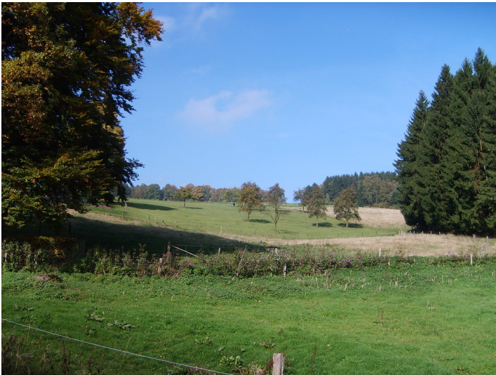
Obstwiese "In der Schlade" (2008)