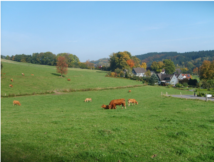
Ackerterrassen bei Niederwette (2008)