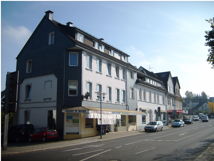
Häuserzeile aus der zweiten Hälfte des 19. Jahrhunderts in Marienheide (2009)