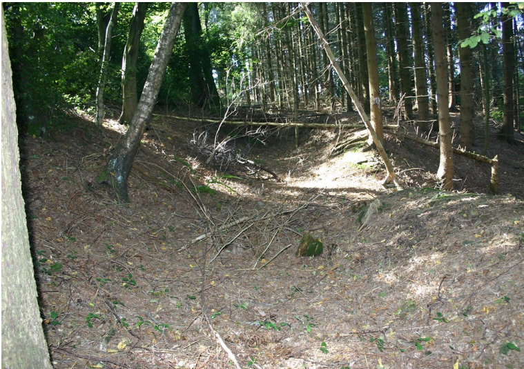
Hohlwege an der Kohlenstraße bei Niederhagelsiepen (2007)