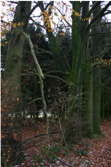
Buchen am Hohlweg bei Böckel (2008)

Schlagwörter: Hohlweg , Baumreihe Fachsicht(en): Kulturlandschaftspflege Gemeinde(n): Hückeswagen Kreis(e): Oberbergischer Kreis Bundesland: Nordrhein-Westfalen