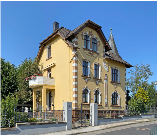
Stadtvilla Hölterhofer Straße 2 in Radevormwald (2021)