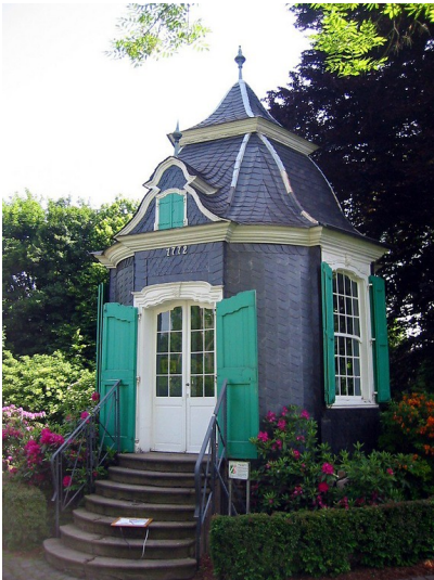
Der Gartenpavillon im Chateaubriant-Park in Radevormwald (2008). Das einzige Gebäude, das den Stadtbrand von 1802 unbeschadet überstanden hatte.