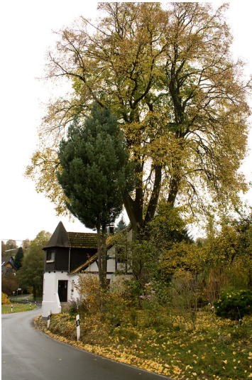
Mühlengebäude mit Hauslinde in Hüttenermühle (2013)