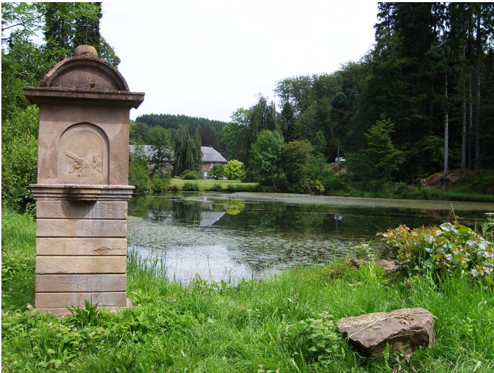
Kreuzwegstation mit der Darstellung "Simon von Cyrene trägt das Kreuz" vor dem Schlossteich in Gimborn (2009)