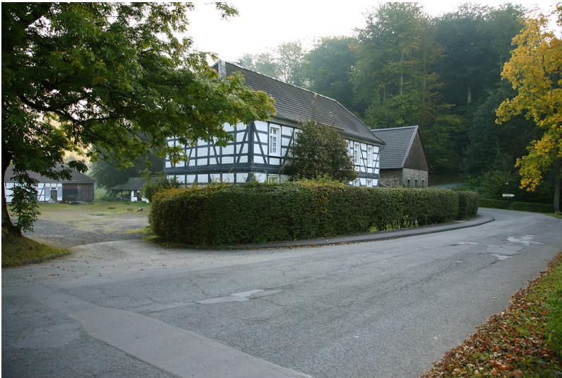
Denkmalgeschützter ehemaliger Pachthof in Gimborn (2008)