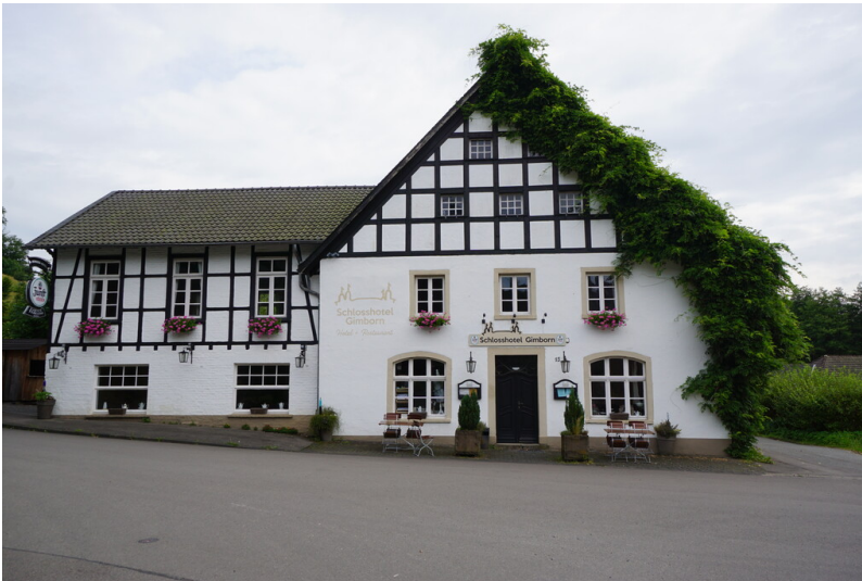
Gasthof in Gimborn (2024)