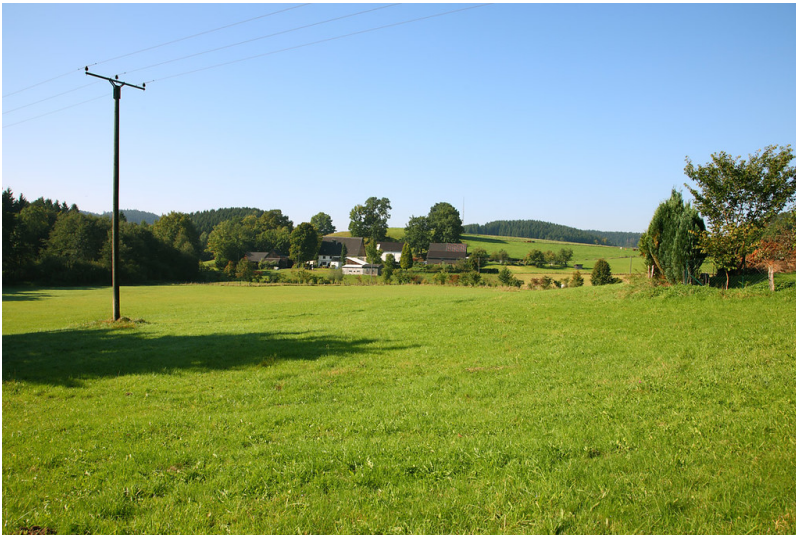
Blick auf Schulzenkamp aus östlicher Richtung (2008)