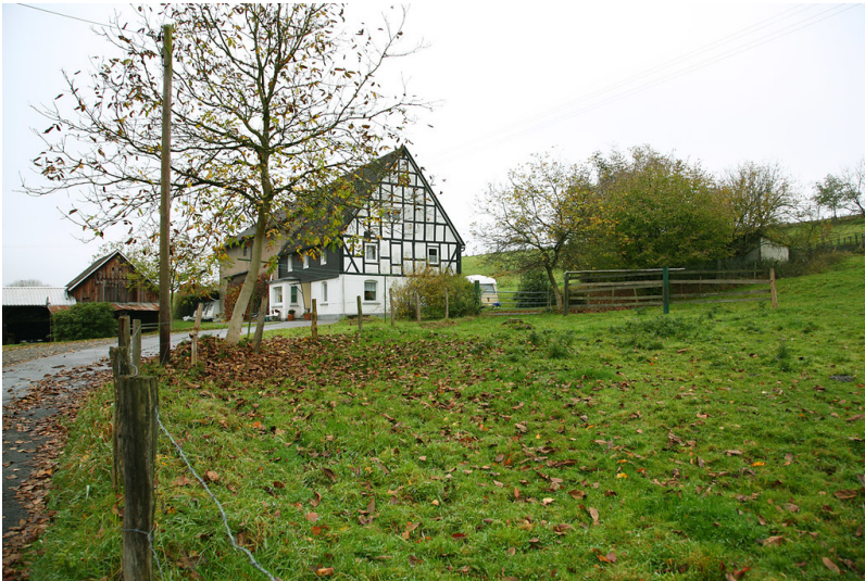
Fachwerkhaus in Niederkotthausen (2008)