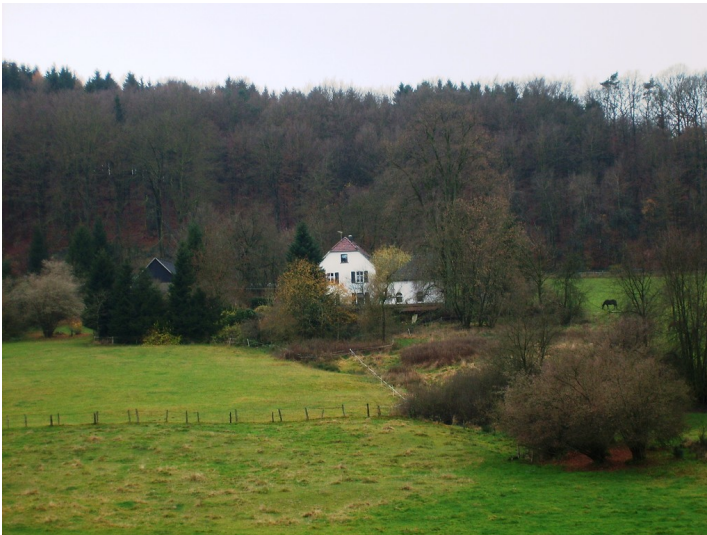
Einzelhof Henneckenbruch (2008)