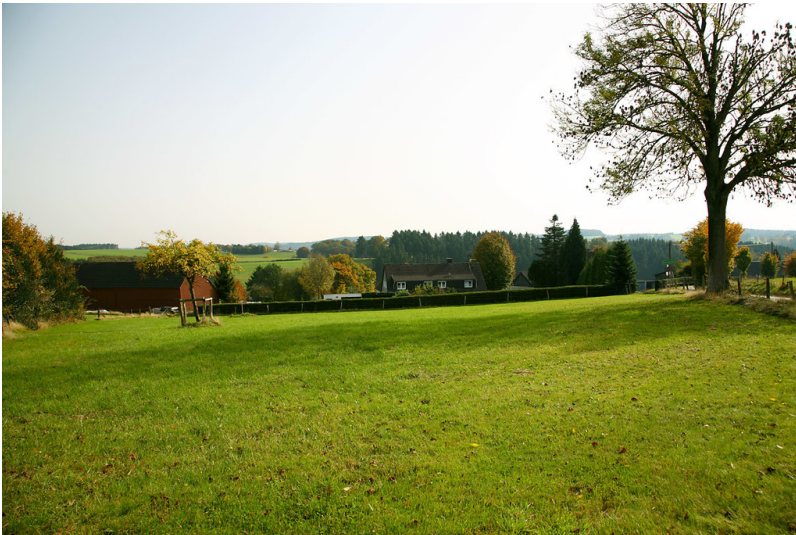
Blick auf Dievesherweg (2008)