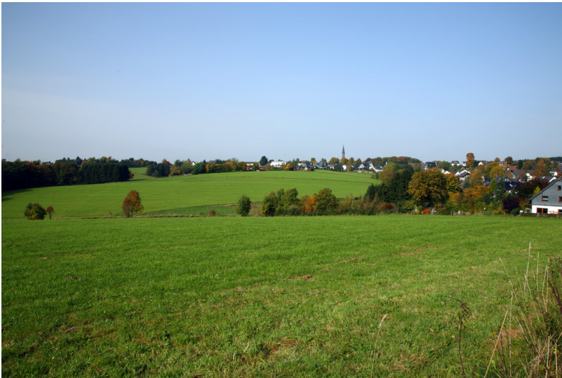
Blick auf das Kirchdorf Kreuzberg (2009)