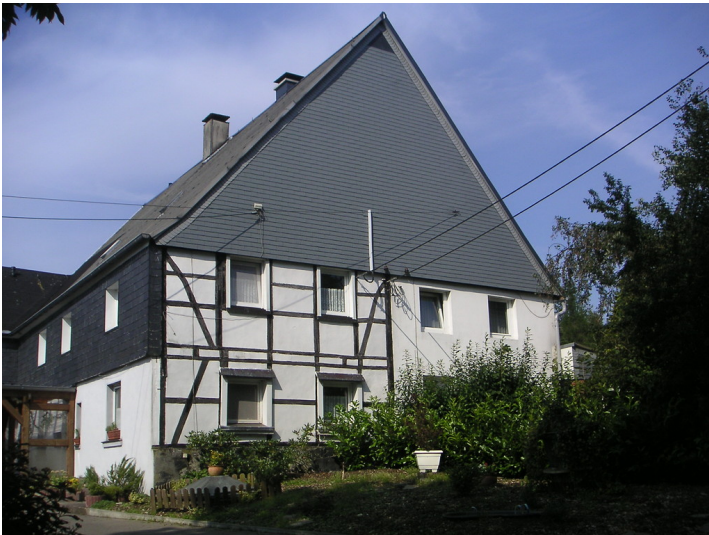
Giebelgeteiltes Wohnhaus in Berge (2008)