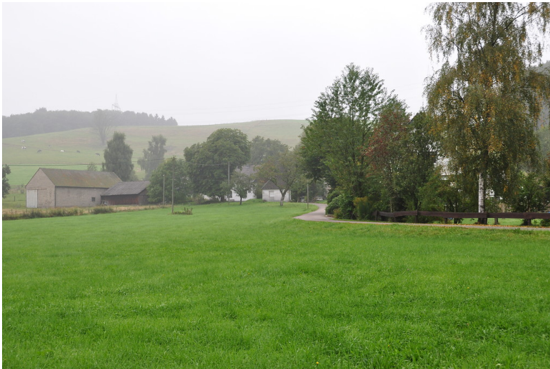
Historischer Teil Neeskottens mit Wirtschaftsgebäuden, Hausbaum und Wiesen (2013)