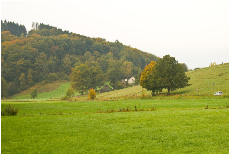
Bühlstahl aus östlicher Richtung (2013)