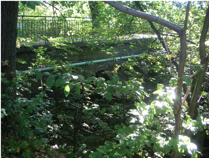
Alte Eisenbahnbrücke bei Busenberg (2007)