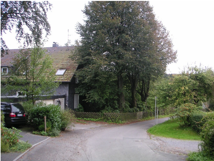
Schule in Busenbach (2007)