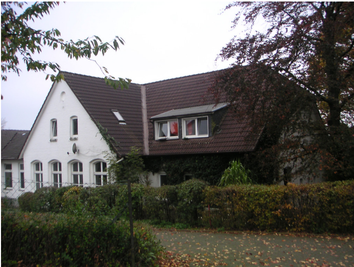
Schule in Straßweg (2007)